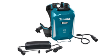
NLBPDC1200A02 Ruggedragen Accu PDC1200 Incl.