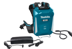
NLBPDC1200A02 Ruggedragen Accu PDC1200 Incl.