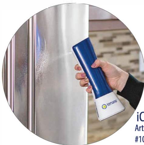
iClean mini Artiklnr. LQFC220 #10301219

* Ga voor meer informatie over de testresultaten van sanitizing naar www.tersano.com .